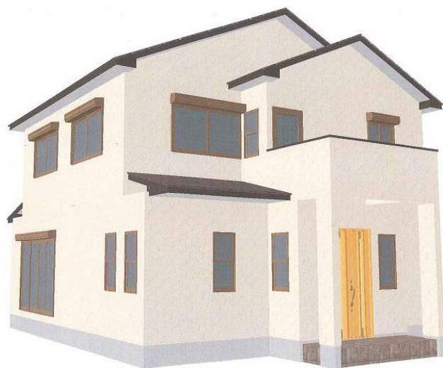
○様邸立面イメージプラン