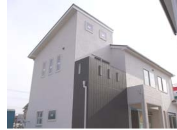
足場が取れました。