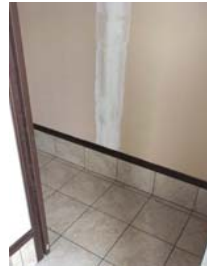
土間収納のタイル