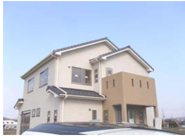
足場が取れました。