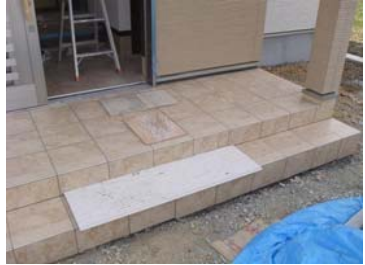
玄関ポーチのタイル