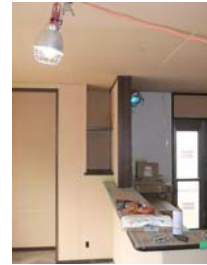
ベッドスペースに飾り棚

造作工事も終わり、現在は基礎の刷毛引きやタイル工事も終わっています。 クロス工事も進んでいます。抗酸化工法ですのでクロスに抗酸化溶液を混ぜて 施工していますが、糊の匂いが全然しません。完成まであともう少しです！