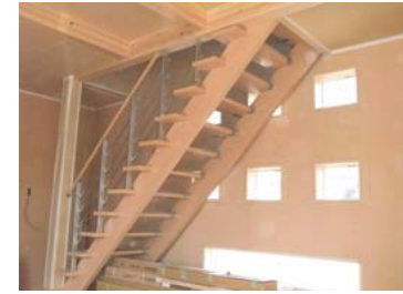
階段の手すりはアルミ製です。パイン材の腰板張り