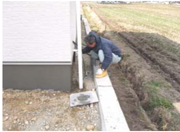
基礎刷毛引きの様子