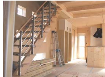
階段掛かりました。