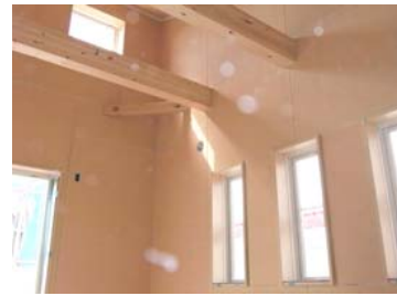
二階寝室の吹抜け天井