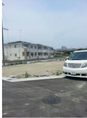
TE様邸日影図3階建てにはこれが必要です！