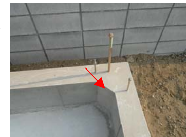
立ち上がり巾15cmの基礎