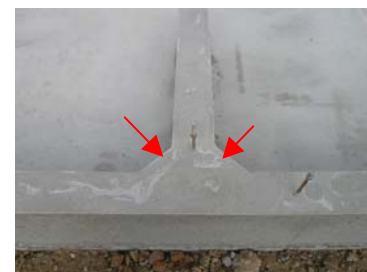
ハンチをとって強靱に！