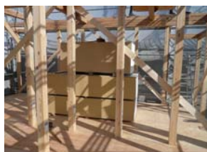
4寸（12cm角）の柱標準です。びくともしない二階の床