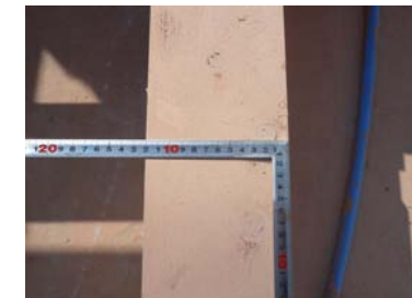
ひのき4寸（12cm角）の土台